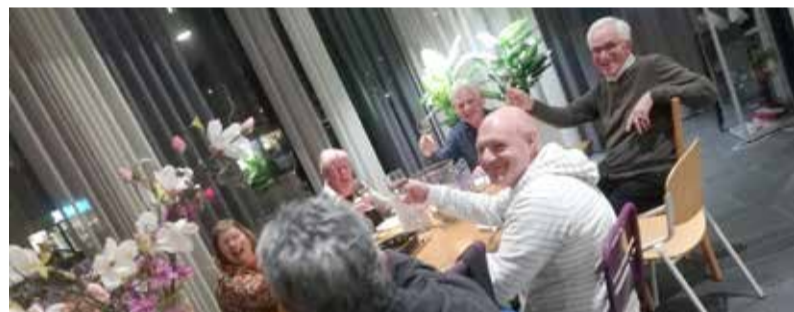
Aan tafel in de Oosterkerk. Degelijke kost: linzensoep, zuurkoolschotel en vruchtensalade, met een mooie witte wijn uit de Betuwe.

GELOVEN AAN TAFEL • Wat geloven we eigenlijk? Er zijn meer dan dertig verschillende kerken in Zoetermeer: van orthodox tot vrijzinnig, van hoogkerkelijk tot hartstochtelijk, van oer-Nederlands tot migrantenkerken van all-over-the-world.